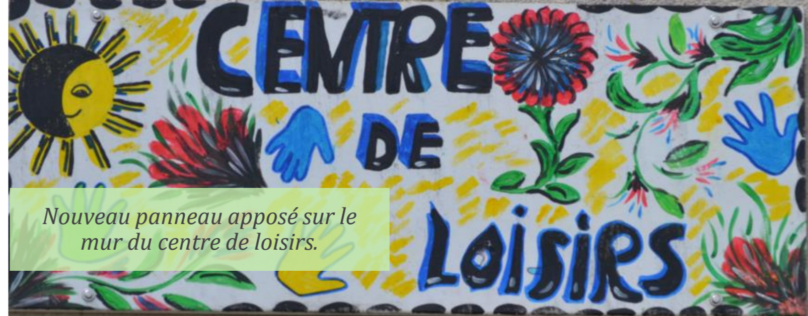
Nouveau panneau apposé sur le mur du centre de loisirs.

Nous vous remercions pour votre participation et pour l'accueil réservé aux agents recenseurs.