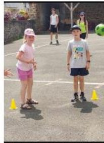
Et si on faisait un relais