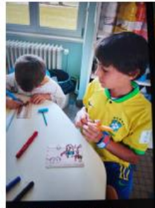
A chacun son activité

Un nouveau bureau a été aménagé par la commune au centre de loisirs :