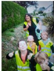
De la complicité