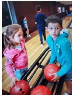
Pour une après-midi sympa au bowling

Concernant les vacances de Noël, le centre ouvrira du 2 au 5 janvier 2024.