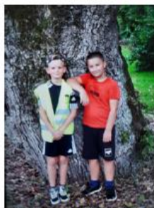
Alors qui est le plus grand ?