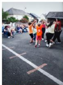
La danse du casino